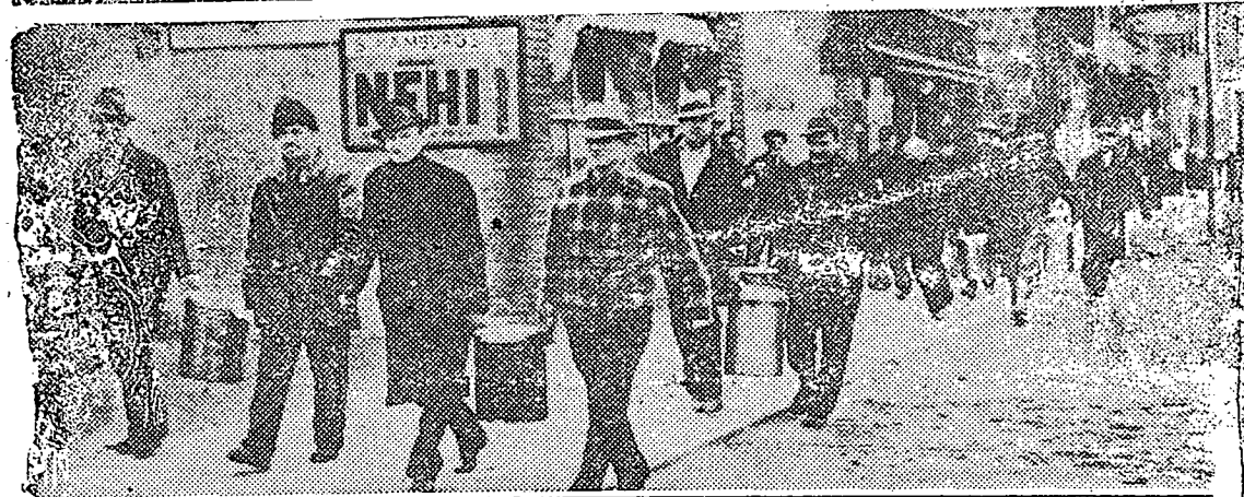
LOS TRABAJADORES YANQUIS SE DESIERTAN.—Obreros después de haber triunfado en última huelga. En Estados Unidos la Revolución Social no está lejana.