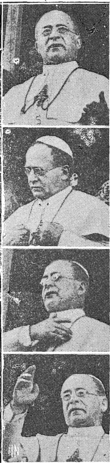
S. S. el Papa Pio XI bendice las tropas italianas y los cañones fascistas que masacraron al pueblo etíope para civilizarlo como quieren civilizar al pueblo español.

Sin entrar de una vez en su análisis minucioso, lo cual haremos en un segundo artículo mediante la prueba estadística, nos basta por ahora aseverar que no es un presupuesto balanceado que es legítimo suponer que la falsedad en que se funda no tiene otro objeto que abrirle el paso a toda esa serie de nanzas públicas a la trágica situación de 1932. Un presupuesto recursos dolosos, realmente criminales, que condujeron las finanzas balanceado, en el cual el cálculo de las rentas ha sido inflado con el objeto de cubrir sobre el papel el monto de gastos en mientes, sólo es un medio de justificar el recurso de los créditos cuantiosos y del empréstito imperialista. El presupuesto que se da de este actual gobierno, no es más que el prólogo de los desgrahes inminente de los cuales se habla ya en todos los corrillos.